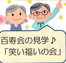
百寿会の見学♪ 「笑い福いの会」

広報誌「ゆいまーる」4月号で西部南圏域内の高齢者サロンおよび生きがいデイサービスを紹介しました。今回は、「近隣の高齢者サロンの活動を見学したい」との要望があり、諸見里公民館での高齢者サロン「百寿会」のメンバーが南桃原公民館での高齢者サロン「笑い福いの会」と県営山里高層住宅集会所での高齢者サロン「スマイルサロン」を見学。お互いに良い刺激になったようです。