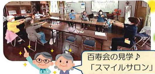
百寿会の見学♪ 「スマイルサロン」