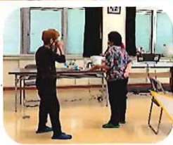
「百寿会」メンバーと 「笑い福いの会」メンバーの 高校卒業以来60年ぶりの 再会も!