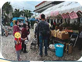
にんじんの詰め放題もありましたよ