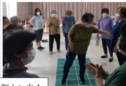
スクエアステップで楽しく脳トレ中♪