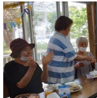
★手作りのごちそうとプレゼント、楽しいゆんたくと歌にとっても喜んでいらっしゃいました★