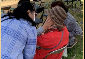
友達同士でゆんたく