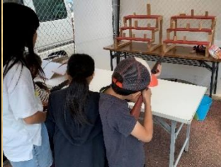
大人気！射的ゲーム