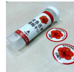
3/6 救急キッドの説明