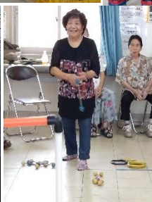
↑登川オリジナルボウリング

かりゆし園よりレク活動用品を数種類借りて、老人会の定例会時にレクレーションを楽しみました。慣れている方も初めての方もいらっしゃいましたが、みんなが楽しめる内容で大盛り上がりでした！しっかりと記録係が点数を記入、納得するまで何回もチャレンジする方も。仲間と笑い・語らいながら体を動かして競い合う、心にも体にも頭にもすごく刺激となる介護予防の活動となりました♪♪♪