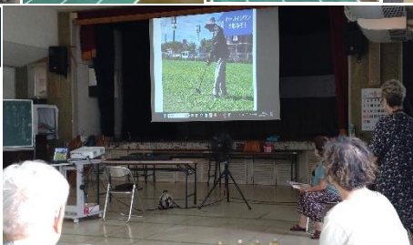
前回の様子をスライドショーで楽しむ